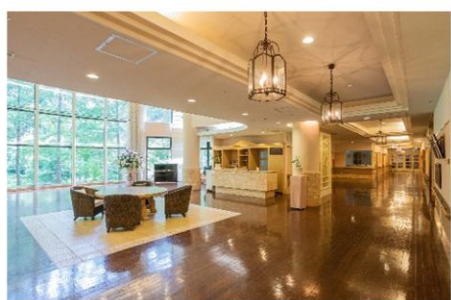
介護老人保健施設ケアテル猪苗代より