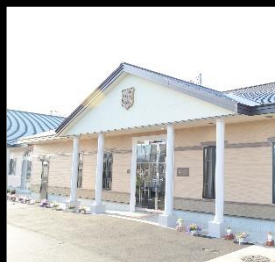
ハーブの園きたかた