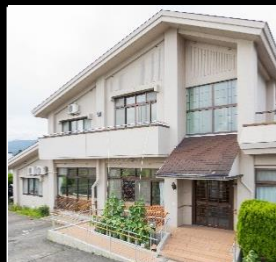
ハーブの園猪苗代