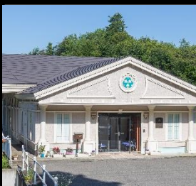
ハーブの園会津若松