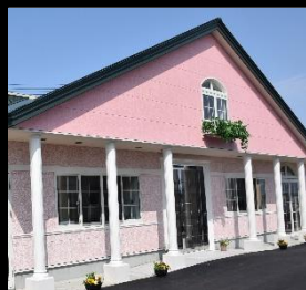
こびとのチャペル