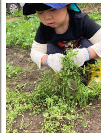
みんな一生懸命！大きいジャガイモが育つといいね！