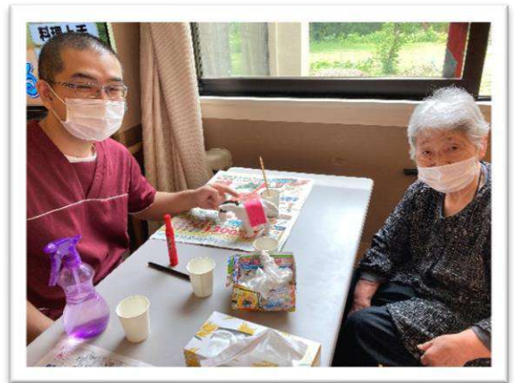
素晴らしい馬が作れました！

通所リハビリテーション「だんらん」では6月27日（日）に、「競馬をやってみる！」というイベントを行わせて頂きました。馬は紙粘土を使用しご利用者様お一人お一人が作成。その馬を使って競馬スゴロクを実施しました。止まったマスには、「早口言葉を言う」「足踏みをする」など、様々な仕掛けが施されており、会場には元気な声が飛び交っていました。優勝者には盾が贈呈されました。次回イベントもお楽しみに！